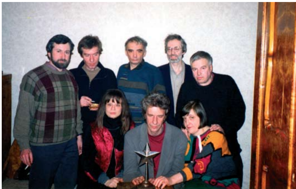
20 лет КД. Слева направо, стоят: Г.К., Н.А., А.М., С.Р., И.М. Сидят: С.Х., Н.П., Е.Е.