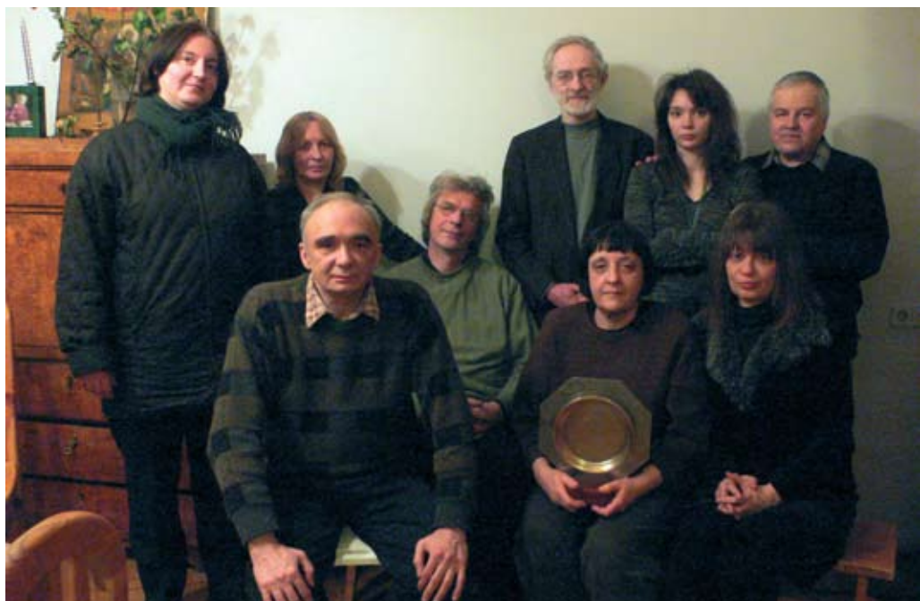
30 лет КД. Слева направо, стоят: В.Х., М.К., С.Р., М.С., И.М. Сидят: А.М., Н.П., Е.Е., С.Х.