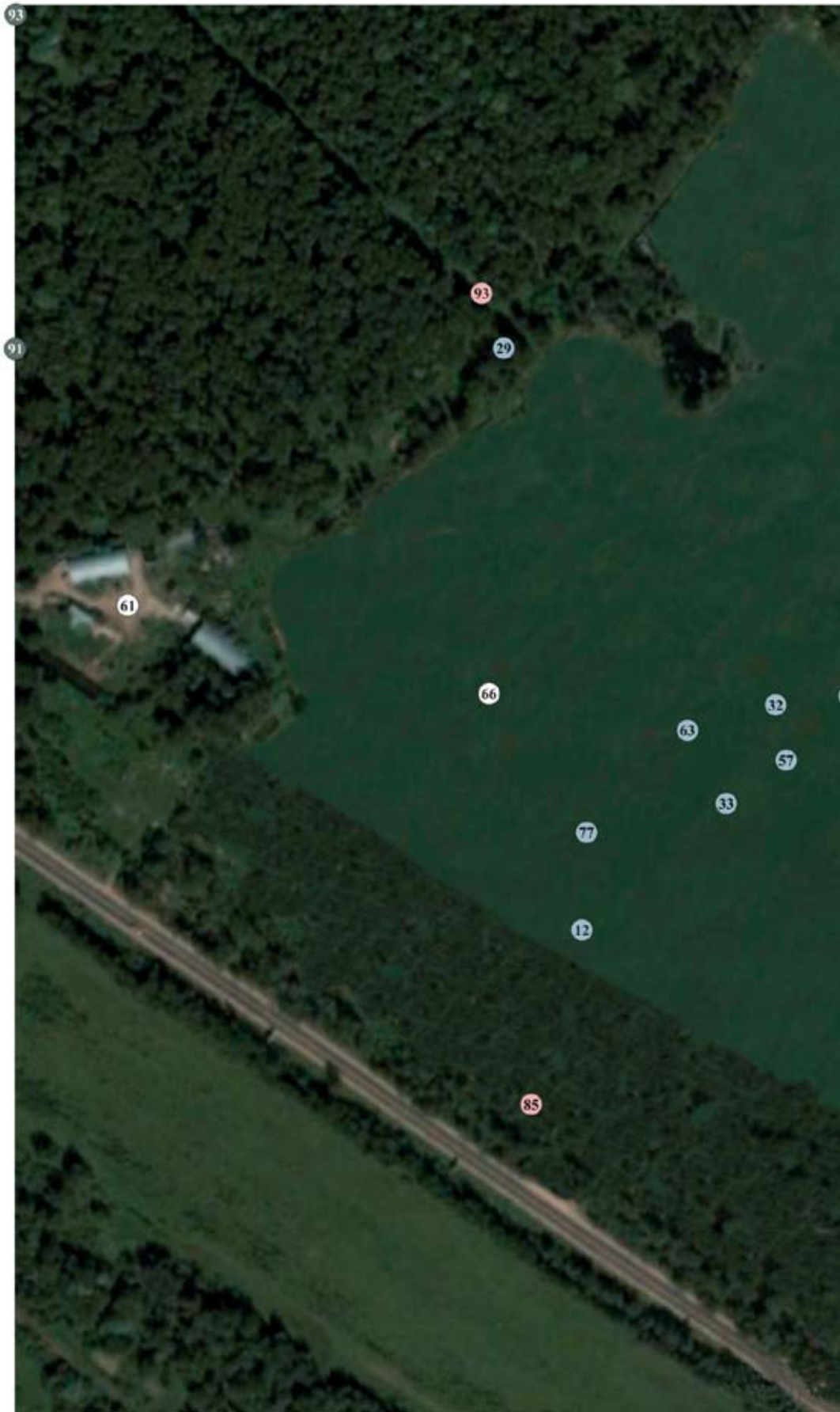
Киевогорское поле с местами проведения акций